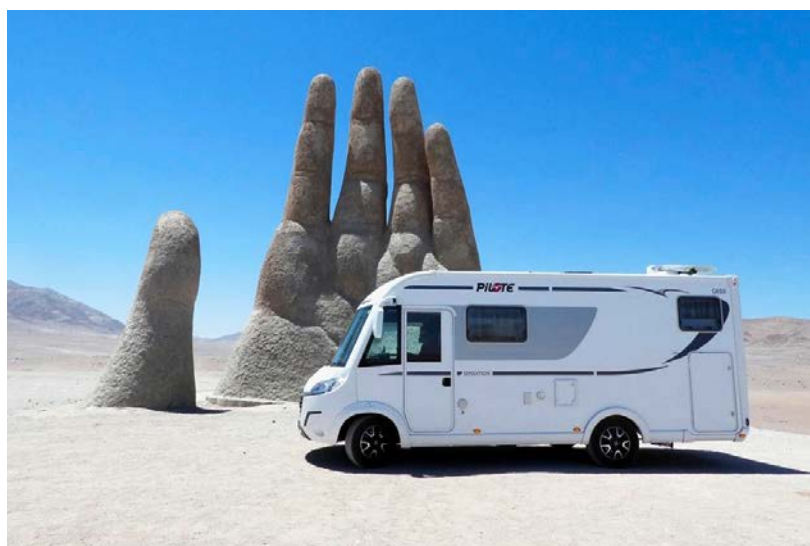
Die 1992 geschaffene Mano del Desierto in der Atacamawüste im Norden Chiles.

Im 26. März 2019, 18.15 bis 19.30 Uhr, in der Geschäftsstelle des Sektion Zentralschweiz. Mitglieder Eintritt frei, Nichtmitglieder 10 Franken.