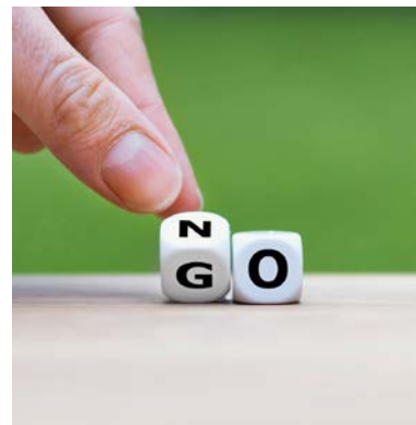
Die Hauptversammlung steht unter dem Thema No-Gos in der geriatrischen Pflege.