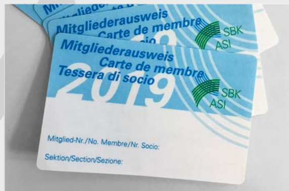
Eine SBK-Mitgliedschaft bietet jedes Jahr viele Vorteile.

Alle Angebote unter www.sbk-asi.ch/Special