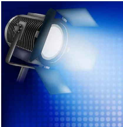
Events am Internationalen Tag der Pflege machen auf die wertvolle Arbeit der Pflegenden aufmerksam.