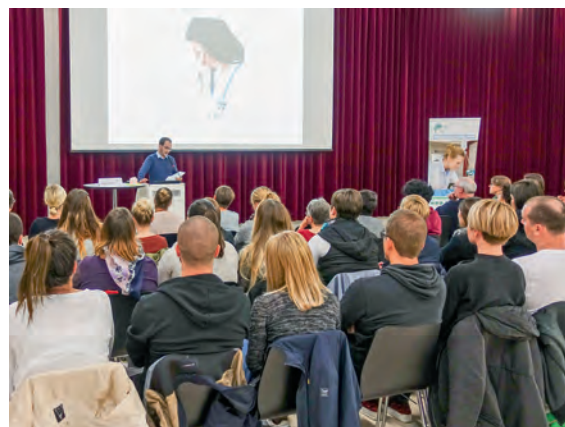
Wie gehen wir mit Fehlern um?

Beide Referate zeigten, dass es für eine Sicherheitskultur sowohl ein proaktives klinisches Risikomanagement als auch ein