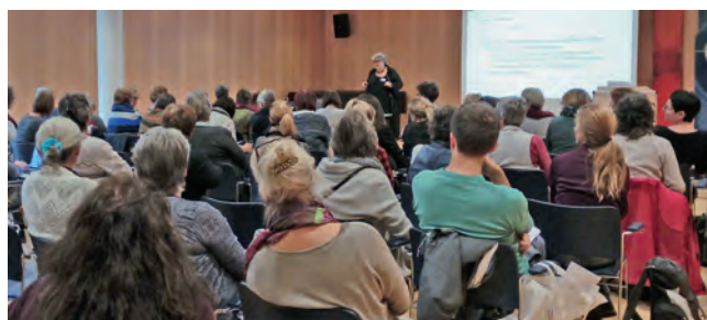
Advance Care Planning im Fokus.

8.30 bis 12 sowie 13 bis 17 Uhr, und am Mittwoch von 8.30 bis 12 Uhr unter 031 380 54 64. Für SBK-Mitglieder ist die Beratung kostenlos.