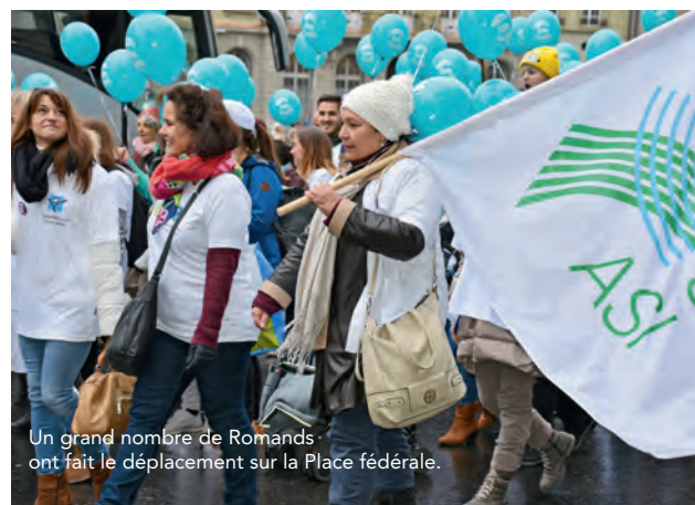
Un grand nombre de Romands ont fait le déplacement sur la Place fédérale.

Le compte-rendu du dépôt de l'initiative sur les soins infirmiers se trouve en page 50 de cette édition.