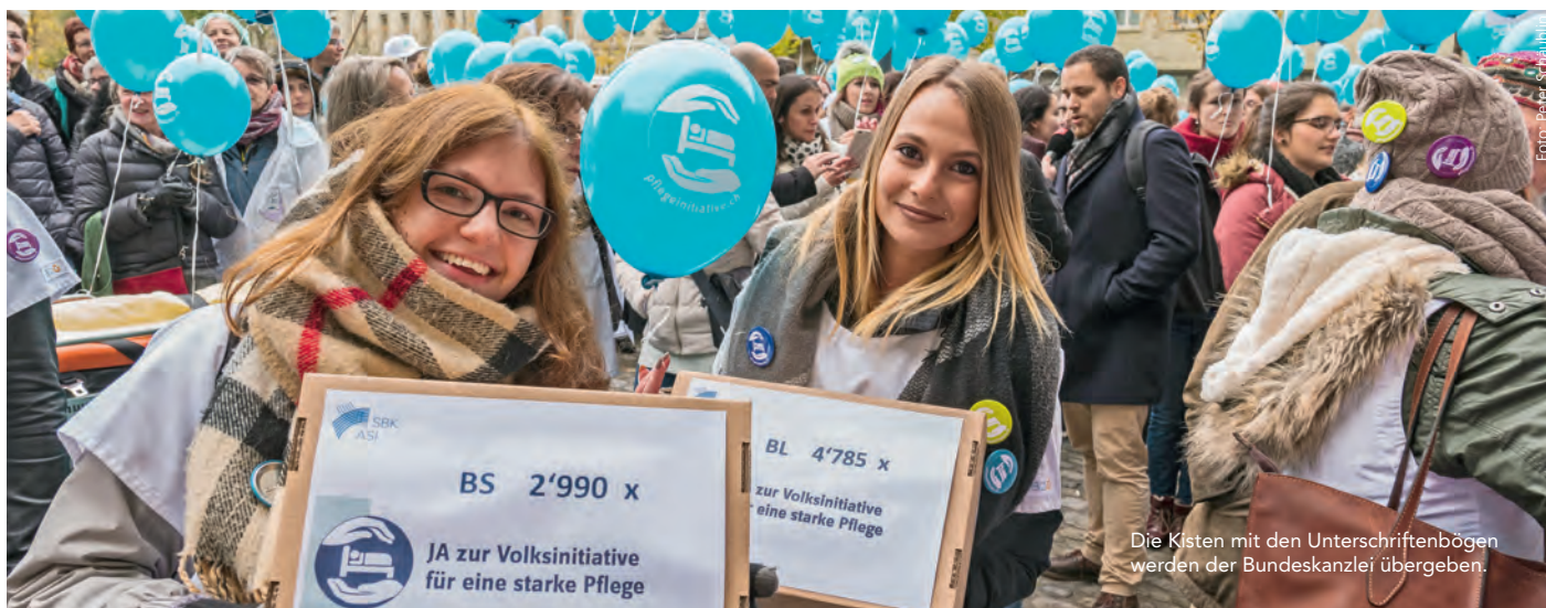
Die Kisten mit den Unterschriftenbögen werden der Bundeskanzlei übergeben.