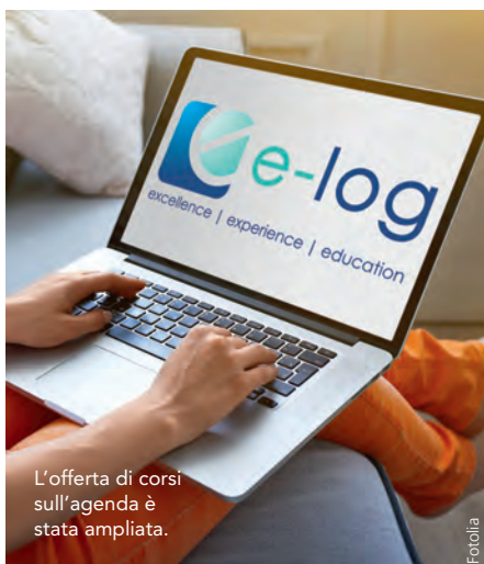
L'offerta di corsi sull'agenda è stata ampliata.