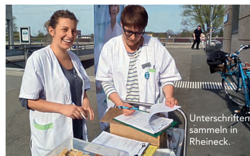
Unterschriften sammeln in Rheineck.

hinein sammelten sie engagiert Unterschriften. Dabei fanden spannende Begegnungen und bereichernde Gespräche mit einheimischen Passantinnen, ÖV-Reisenden, Kiosk-Kundinnen, Berufsschülern und vielen Touristinnen aus der ganzen Schweiz statt. Schliesslich geht das Thema uns alle an, hoffen wir doch, jederzeit professionell und fürsorglich gepflegt zu werden – besonders im Alter.