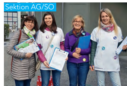
In Aarau, Olten, Solothurn, Baden und Rheinfelden sammelten SBK-Mitglieder 700 Unterschriften (Bild: Sammeltag in Aarau).