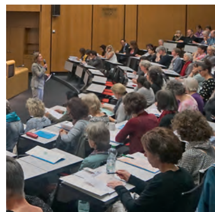
Voller Hörsaal im Berner Inselspital.