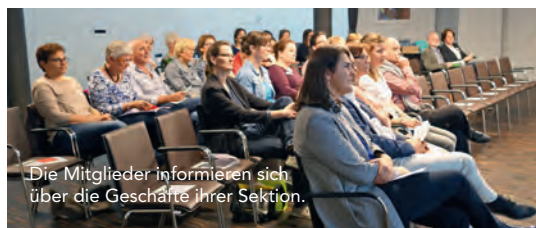
Die Mitglieder informieren sich über die Geschäfte ihrer Sektion.