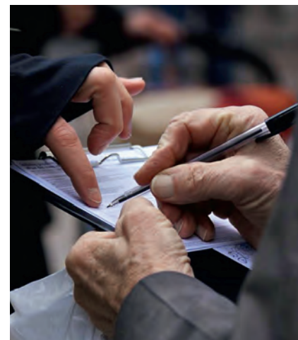
Chaque signature compte pour des soins infirmiers forts.

ASI Suisse: Une journée nationale de récolte de signatures pour l'initiative sur les soins infirmiers aura lieu le 12 mai prochain, à l'occasion de la Journée internationale de l'infirmière. Les sections organiseront des actions de récolte partout en Suisse. Des conférences et différentes manifestations seront également prévues ce jour-là afin de sensibiliser la population aux revendications en faveur des soins et de la sécurité des patients.