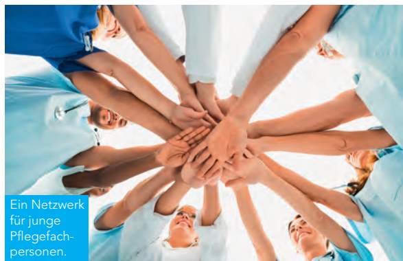
Ein Netzwerk für junge Pflegefachpersonen.

BE: Es ist kein Geheimnis, dass viele Mitglieder des SBK Bern in den nächsten Jahren pensioniert werden und zugleich zu wenig junge Pflegefachleute für die Mitgliedschaft gewonnen werden können. Für die Sektion ist klar, dass sie vermehrt Themen aufnehmen muss, die Junge interessieren und dazu motivieren, beim Verband mitzuwirken. Aber welche Themen beschäftigen junge Pflegende? Was würden sie gerne ändern? Um mehr über die aktuelle Situation von jungen Pflegenden zu erfahren, hat die Sektion den Jungen SBK Bern ins Leben gerufen. Im Herbst 2016 hat sich eine schlagfertige Truppe formiert. Alle Mitglieder des Jungen SBK sind stolze Berufsleute und arbeiten gerne in ihrem Beruf. Trotzdem ist es für sie im Alltag oft nicht einfach. Die Belastung nimmt in den meisten Betrieben stetig zu und die Arbeitsbedingungen verschlechtern sich. Viele junge Pflegefachleute steigen in den ersten Berufsjahren aus und suchen sich eine andere Beschäftigung.