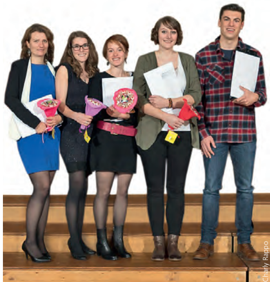
Cinq bacheliers en soins infirmiers ont été primés par la section fribourgeoise pour l'excellence de leurs travaux.

Les lauréats recevront également l'adhésion gratuite à l'ASI pour 2017. L'ASI-Fribourg a tout à gagner de ces échanges avec ces jeunes diplômés. Ils sont une richesse pour la profession infirmière et assurent la relève.