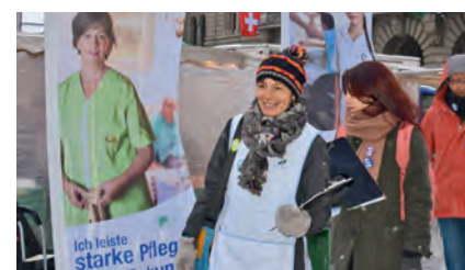
Malgrado il freddo, un gruppo di volontari per la raccolta delle firme si sono subito messi all'opera.

Per maggiori informazioni: www.per-cure-infermieristiche-forti.ch