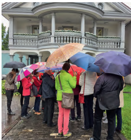
18 interessierte Frauen und ein Mann trotzten dem nassen Wetter.

Eine Führerin vom Tourismus Altdorf präsentierte, mit wunderbarem Urner Dialekt und viel gutem Humor, die einzelnen Sehenswürdigkeiten. Ein paar wichtige Etappen des Rundganges waren das 1805 erbaute Rathaus, das bronzenes Teildenkmal von Walter Richard Kissling und das 1490 erbaute Fremdenhospital, wo viele Durchreisende Obdach und Nahrung fanden. Und natürlich nicht zu vergessen, das Haus Suworow, ein spätgotischer Bau mit malerischen Treppengiebeln, in dem General Suworow auf seiner Rückreise aus Italien übernachtete. Auch in die zeitgenössische Urner Kunst wurde eingeführt.