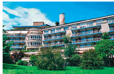
Ein Novum in der Region Basel: Johanniter in der Palliativpflege zertifiziert.

Die Sektion setzt sich auf verschiedenen Ebenen für eine hohe Qualität der palliativen Versorgung ein: In der Politik mit Stellungnahmen zu entsprechenden Gesetzen, in der Weiterbildung mit ihrem Schwerpunkt Palliative Care und in Gesprächen mit den Verantwortlichen