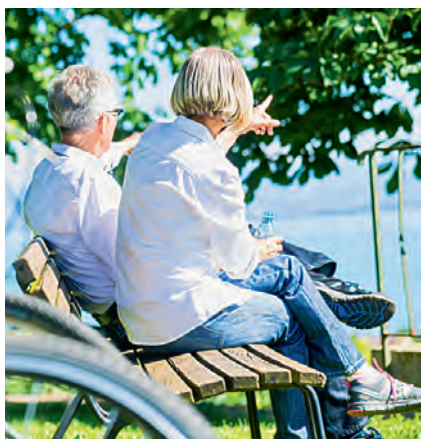
Pensionierung in Sicht?

Die Beratung findet am Dienstag, 20. September 2016 in den Büros von Glauser + Partner in Bern statt. Eine Kurzberatung kostet Fr. 60.– für SBK-Mitglieder und Fr. 100.– für Nichtmitglieder. Bei Interesse melden Sie sich bitte bis zum 6. September 2016 unter www.sbk-be.ch/finanzberatung oder per Telefon 031 380 54 64 an.