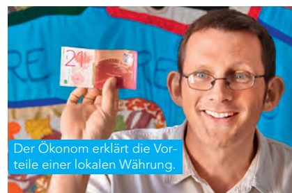
Der Ökonom erklärt die Vorteile einer lokalen Währung.

L'ASI est sur facebook: www.facebook.com/sbk.asi