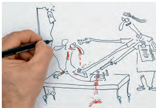
Snapshot tiré du film «Découvrez l'impact des soins infirmiers!»

Ces cartes peuvent être obtenues auprès des sections de l'ASI ainsi que dans le shop en ligne sur www.sbk-asi.ch .