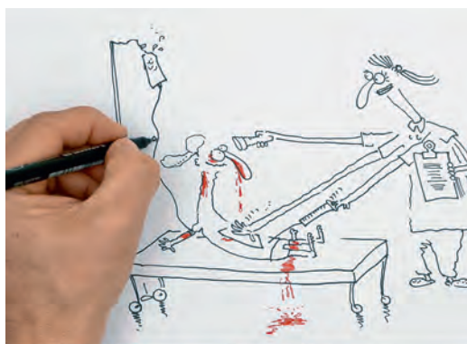
Un'immagine dal film «Che cosa si intende per cure infermieristiche?»