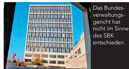
Das Bundesverwaltungsgericht hat nicht im Sinne des SBK entschieden.

SBK Schweiz: Bezüglich der vom SBK und einiger seiner Mitglieder eingereichten Rekurse hat das Bundesverwaltungsgericht (BVGer) Ende März die ersten negativen Entscheide gefällt. Das Gericht anerkennt die Legitimation des Staatssekretariats für Bildung und Innovation (SBFI), die Bedingungen für den nachträglichen Erwerb des Fachhochschultitels für Pflegefachpersonen festzulegen. Des Weiteren stellt es den Entscheid des SEFRI nicht in Frage, für einen nachträglichen Titelerwerb einzig die an einer Fachhochschule für Gesundheit erworbenen ECTS anzurechnen. In anderen Studiengängen erworbene Führungs-, Casemanagement- oder pädagogische Kompetenzen finden