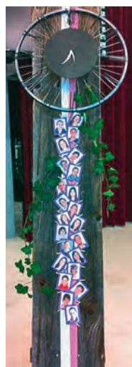
Kunstvolle Präsentation beim Eingang.