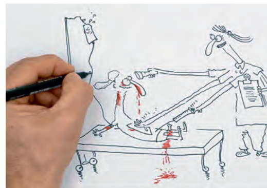
Snapshot aus dem Film «Was ist professionelle Pflege?»

die vielfältigen Aufgaben von Pflegefachpersonen aufgezeigt. Der Film steht ab dem 12. Mai unter www.professionellepflege.ch in drei Sprachen zur Verfügung. Um ein möglichst breites Publikum auf die Bedeutung der professionellen Pflege aufmerksam zu machen, können Postkarten zum Film verschickt, verteilt und aufgelegt werden. Diese sind bei den SBK-Sektionen sowie im Online-Shop unter www.sbk-asi.ch erhältlich.