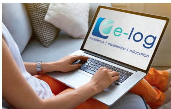
e-log ist für SBK-Mitglieder kostenlos.

Les fonctionnalités et le login entreront en fonction en mars et seront accessibles gratuitement à tous les membres de l'ASI. Le site d'e-log quant à lui sera mis en ligne dès janvier et les sections notamment pourront y faire labelliser leurs formations.